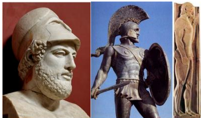
Pericle, un soldato spartano e un oplita greco

Ilioti: erano i discendenti delle popolazioni sottomesse e non avevano diritti. Coltivavano la terra, non partecipavano al governo della città: Erano temuti dagli spartiati per via del fatto che erano assai numerosi quindi non venivano addestrati alla guerra e non potevano possedere armi.