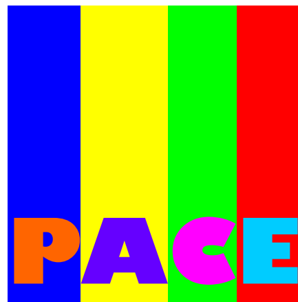
Le classi prime A. s. 2012/13